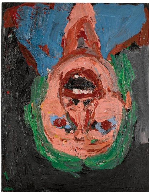
Georg Baselitz: Položený portrét

Za mesiac máj pribudlo na náš účet s VS 123 spolu 549,53 EUR (do 29.5.)