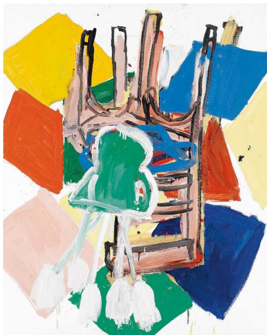
Georg Baselitz: Motiv