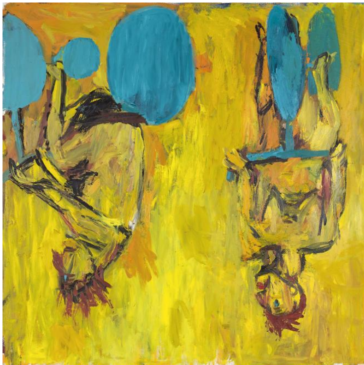
Georg Baselitz Dievčatá z Olmo