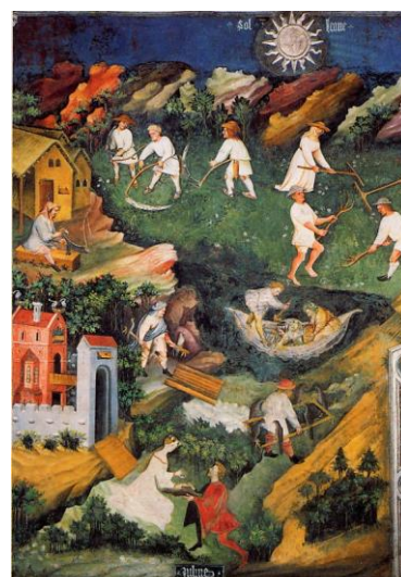
Majster Václav: Dvanásť mesiacov (máj, jún, júl)