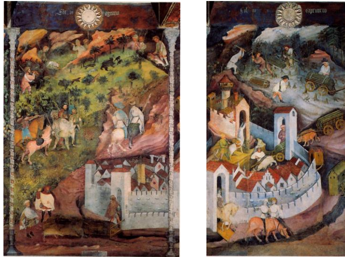
Majster Václav: Dvanásť mesiacov (november, december)