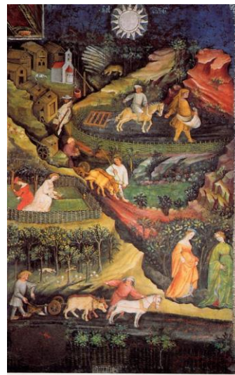
Majster Václav: Dvanásť mesiacov (január, február, apríl)