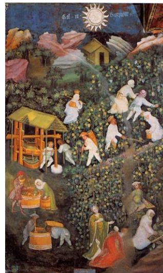
Majster Václav: Dvanásť mesiacov (august, september, október)